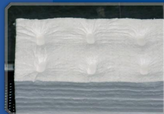
duotherm Module – montieren und fertig! Die Module bleiben in Form!