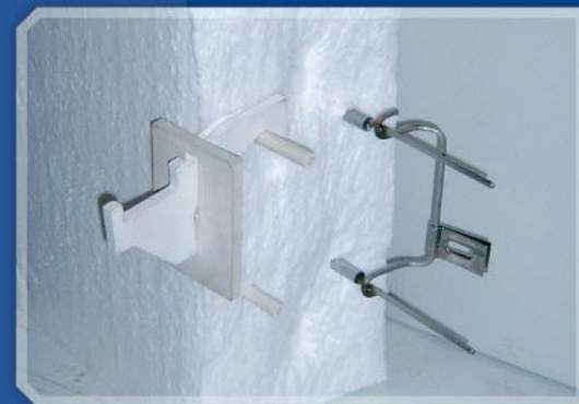
Modul Anker Keramik