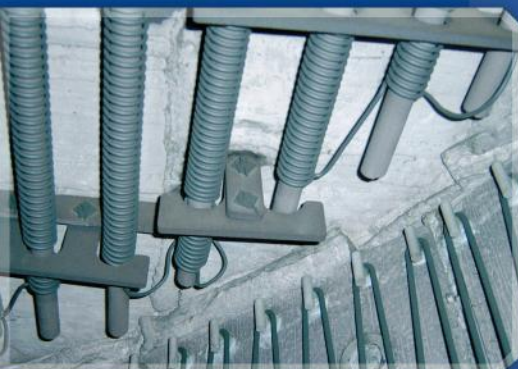
Montage mit dem duotherm System für Decken- und Wandheizungen