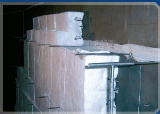
Modulmontage mit dem duotherm Ankersystem