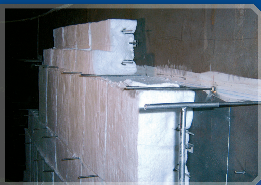
Modulmontage mit dem duotherm Stark Ankersystem