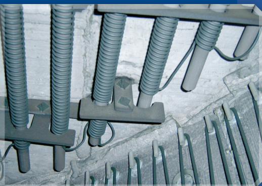
Montage mit dem duotherm Stark System für Decken- und Wandheizungen