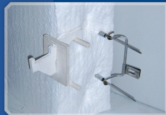
Modul Anker Keramik