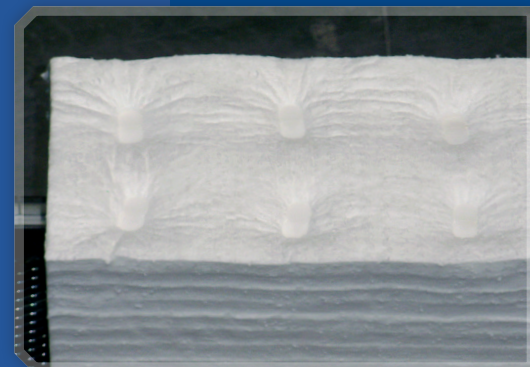
duotherm Stark Module - montieren und fertig! Die Module sind und bleiben rechteckig und werden nicht faßähnlich.